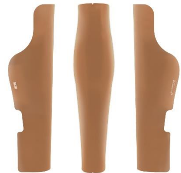
COV-367 Dark skin