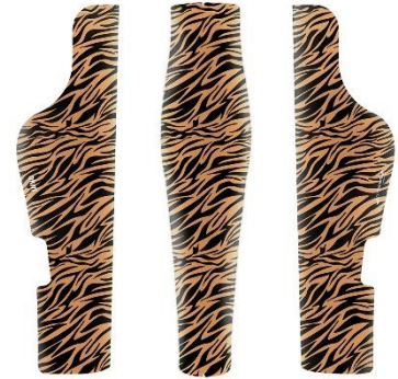
COV-369 Tiger Velvet