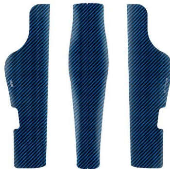
COV-516 Blue Carbon